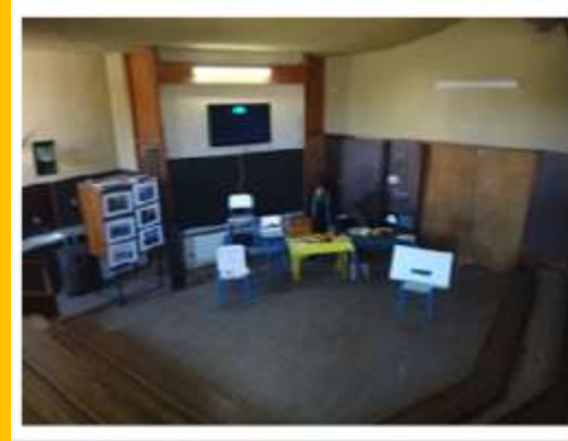
ESCUELA N° 3 “FRANCIA” PUNTA CARRETAS MONTEVIDEO

Este año se hará especial hincapié en las escuelas de práctica. Nuestro museo busca presentar al alumno un material que motive e ilustre la historia de la escuela uruguaya transmitiendo los conceptos de patrimonio e identidad, así como dar instrumentos a los docentes para crear la historia institucional y organizar la puesta museográfica de objetos aportados por la comunidad.