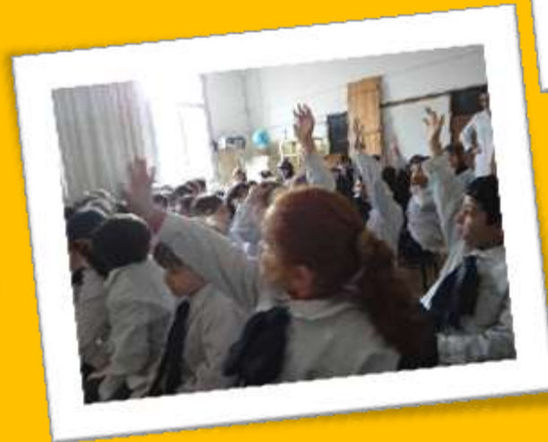
ESCUELA N° 83 “MARTÍN ETCHEGOYEN”