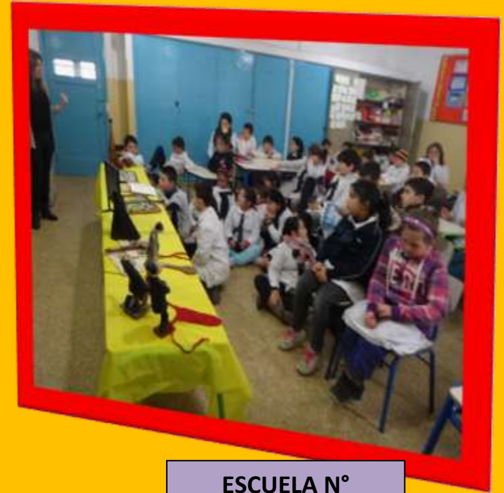
ESCUELA Nº 26 “PAÍSES BAJOS” 27/8/14